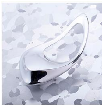
NAGAE+ コリネットリンパ