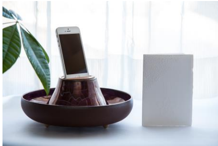
Ejp(East Japan Project) OTO