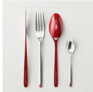
KEN OKUYAMA DESIGN STILE 漆