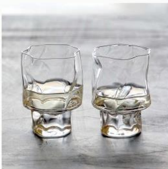
木村硝子 クラブルワイン ペア

お寺やお祭の旗などを染める印染という技法で白、紺、赤と色を絞り、干支と縁起物の図柄だけを使っている。