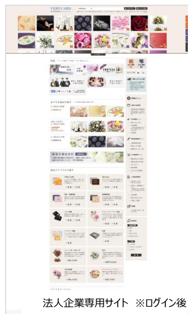
法人企業専用サイト ※ログイン後